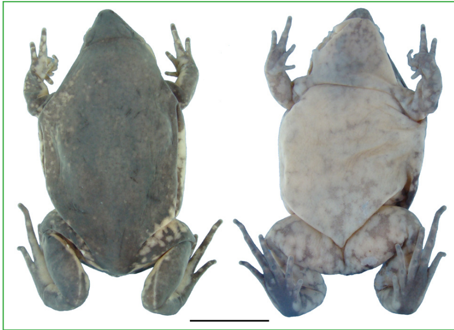
FIGURA 1: Exemplar fêmea adulta de Elachistocleis ovalis coletado (MNRJ 54366). Visão dorsal (esquerda) e ventral (direita). Barra de escala: 1cm.

Durante amostragens da anurofauna na sub-bacia do rio Muriaé, no noroeste do Rio de Janeiro, um exemplar fêmea adulta de E. ovalis (Figura 1) foi coletado no norte do Município de Itaperuna, atropelado na rodovia RJ 214 ( 21^{\circ}05'20,24''S ; 42^{\circ}03'15,17''O ; 219m altitude) (Figura 2). A vegetação local é caracterizada como floresta estacional semidecidual e a área apresenta